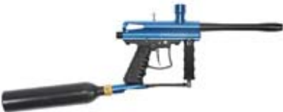
Paintballwaffen (keine Feuerwaffe)