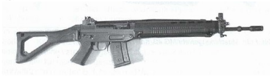
Halbautomatische Gewehre wie z.B. Sturmgewehre PE 90, PE 57