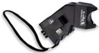
Elektroschockgeräte, welche die Widerstandskraft von Menschen beeinträchtigen oder die Gesundheit auf Dauer schädigen