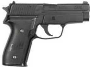
Soft-Air-Waffen (keine Feuerwaffe)