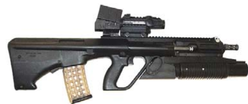
Laser-, Nachtsichtzielgeräte, Schalldämpfer und Granatwerfer als Zusatz zu einer Feuerwaffe