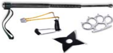
Geräte, die dazu bestimmt sind, Menschen zu verletzen (wie Schlagrute, Wurfstern, Schlagring, Schleuder mit Armstütze)