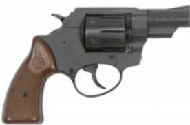
Alarm-, Schreckschusspistolen (mit und ohne Schiessbecher), Imitationswaffen , wenn die Gefahr einer Verwechslung mit einer Feuerwaffe besteht