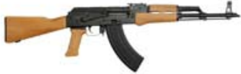
Zu Halbautomaten abgeänderte Seriefeuerwaffen (jedoch nicht zu halbautomatischen Feuerwaffen abgeänderte schweizerische Ordonnanz-Seriefeuerwaffen)